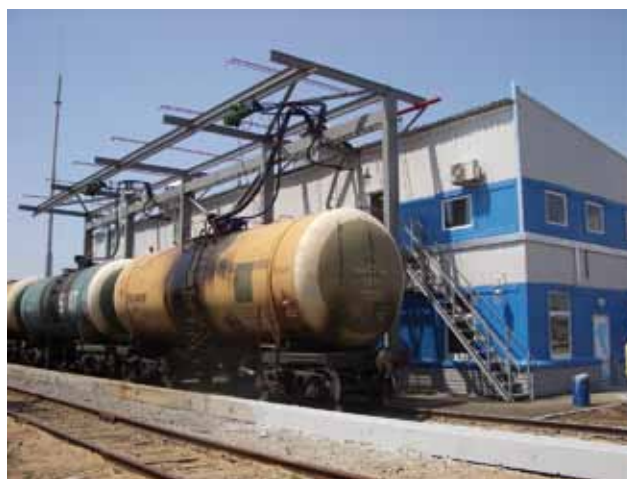
Рис. 2. Один из объектов внутренней обработки котлов, внедренных группой компаний «СТГ»

Компактный формат исполнения основного технологического оборудования получил у разработчиков название «модуль промывочный». Он может перевозиться со склада или другого объекта на нужный объект при помощи железнодорожной или автомобильной платформы. Далее, при подключении к соответствующей инфраструктуре энергообеспечения, модуль запускается в эксплуатацию практически