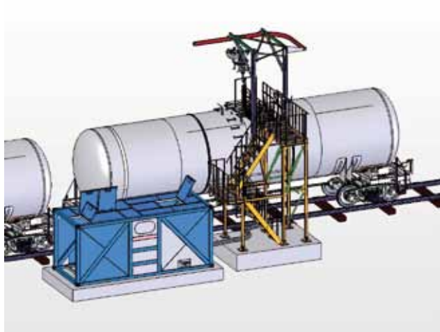
Рис. 3. Упрощенный вариант оборудования для внутренней обработки котла вагона-цистерны

ски без монтажа, т. к. работает с упрощенного фундамента или с основания самой перевозящей его платформы.